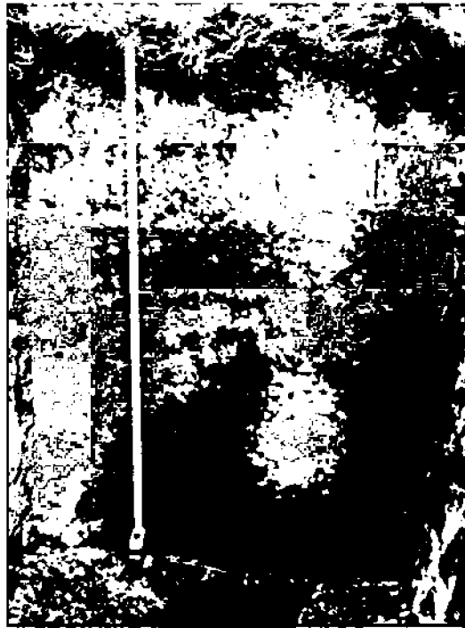
Рис. 1. Почвенный профиль дерново-подзолистой почвы (57.020553, 40.955668)