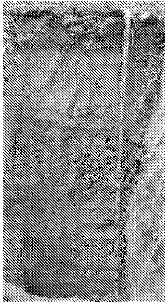
Рис. 1. Почвенный профиль дерново-подзолистой почвы (57.459758, 41.501029)