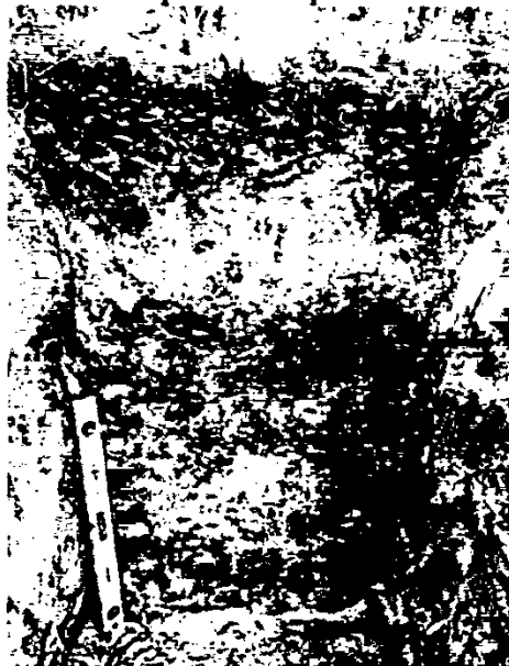
Рис. 1. Почвенный профиль дерново-подзолистой почвы (57.499223, 42.327645)

В пределах Памятника природы распространены дерново-подзолистые почвы, преимущественно неглубокоподзолистые, легкосуглинистые (почвенный профиль дерново-подзолистой почвы (57.499223, 42.327645) представлен на рис. 1). Почвы обладают отчетливой элювиально-иллювиальной дифференциацией по гранулометрическому и валовому составу. Реакция почв кислая, кислотность уменьшается от верхних горизонтов к породе.