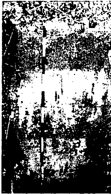
Рисунок 1. Почвенный профиль дерново-подзолистой почвы (56.9968, 40.9852)